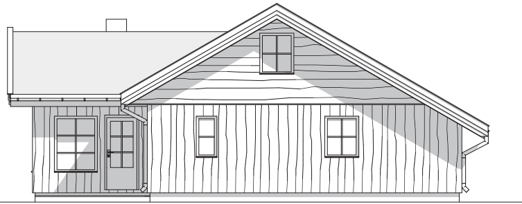
1:100 Fasade 2