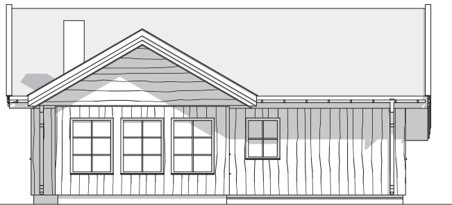
1:100 Fasade 3